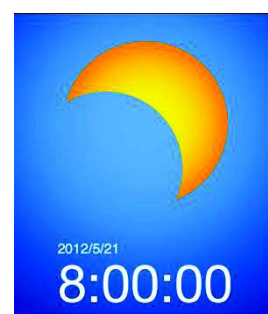
長居公園での太陽の見える方 (iphone アプリ「金環食 2012 による」)

大阪近辺で金環日食が見られるのは7時30分前後の約3分間です。しかしながら、食がスタートするのは6時17分からです。太陽が徐々に欠けていく様子を観測するため、今回は6時30分に長居公園に集合しました。1年生から6年生まで、合計約200名の生徒が参加。当日の朝は薄曇り状態で、金環日食が観測できるかどうか微妙な感じでしたが・・・