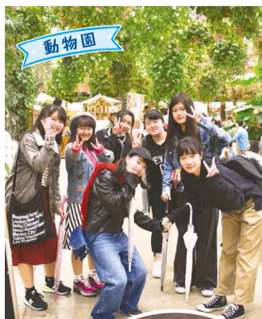
動物園 様々な動物に直に触れることができました!

午前中は3つの施設(神戸どうぶつ王国・神戸布引ハーブ園・海洋博物館&ポートタワー)のいずれかへ行き、午後は事前に調べた観光地や施設を巡りました。メリケンパークを散策する班や神戸異人館を見学する班など、午後からは天候も回復し観光や食べ歩きを楽しむことができました。班別行動を通して、仲間との親睦をさらに深めるとともに、古くから港町として栄え、外国との交流の拠点となった神戸特有の文化に触れることができました。