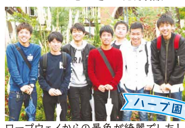
ハーブ園 ロープウェイからの景色が綺麗でした!