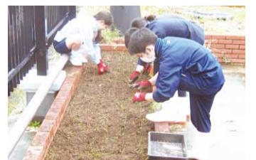
たまねぎの苗の定植作業中