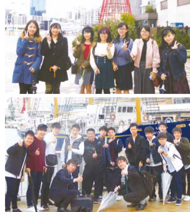
ポートタワーや港の近くで記念撮影