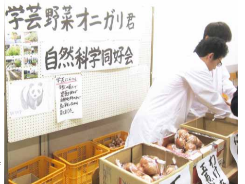
文化祭の模擬店「学芸野菜 おにがり君」