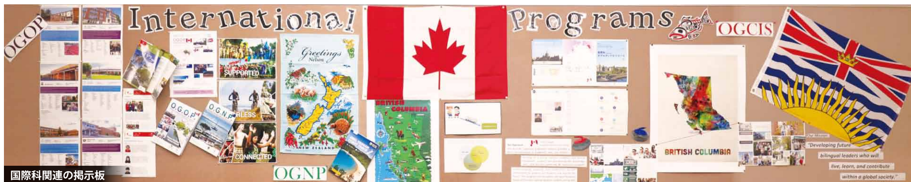
国際科関連の掲示版