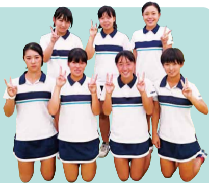
女子団体戦メンバー

私たち女子硬式テニス部は、「やる時はやる」をモットーに、普段は先輩後輩とも明るく仲良く、練習時には一球一球を大切に集中して日々の練習に取り組んでいます。特に平日は、講習などがある分練習時間は減ってしまうため、1分1秒を大切にしています。時間のある休日などは、今度オムニコートに改修された河南町コートで男子と一緒に練習しています。個人戦では、私学大会ダブルス3位、サマーテニストーナメントダブルス準優勝と、テニス部史上初の結果を残しています。団体戦では秋季大会ベスト16で、惜しくもベスト8を逃してしまいました。この悔しさをバネに春季大会団体戦では必ずベスト8以上に入れるよう、ますますテニス部一丸となって邁進していきたいと思っています。