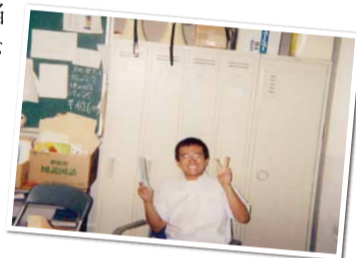
▲生徒自治会活動中

私は、よく遊びました。特に、授業が終わると、チャリ旅と題し住之江区や堺市等友人たちとウロウロしていました。今でも思いますが、夕方の川・海沿いは本当に青春時代にぴったりです。そして2年間生徒自治会活動に関わり、会長もさせて頂いたのは本当に良い経験でした。なんと言っても会長立候補時の公約が「食堂のコロッケ値下げ」でした。もっと生徒自治会行事の改革を掲げれば良かったのですが、当時はコロッケに頭がいておりました。その時についたあだ名は…そのまんまです。また、全校集会では各伝達をしっかり行い、野球の話等ズレた話も喋り、自治会顧問の先生から「お前はちゃんとした話は出来ないのか」と注意を受けたのも、今となっては良い思い出です。