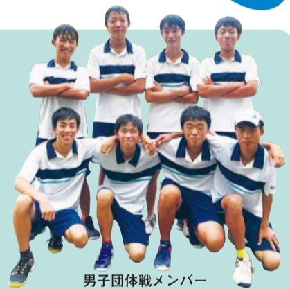
男子団体戦メンバー

僕たち男子硬式テニス部は、人数が多いのと、平日講習などで十分な練習時間が確保できないことから、「一球一球を集中して打つ」を心掛けて練習に取り組んでいます。3年生の先輩達は、創部以来、秋季大会団体戦初の本戦出場、3学区大会団体戦初優勝、春季大会団体戦初の本戦出場とベスト16入りを果たしました。僕たちのチームになって、秋季大会団体戦は2年連続本戦に出場することができ、ベスト16に入りました。個人戦でも各大会本戦出場を目標にしていますが、3学区大会団体戦で連覇すること、春季大会団体戦も2年連続本戦出場し、ベスト16以上の成績を残せることを目標に、テニス部全員で頑張っていきます。