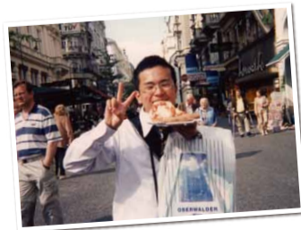
▲オーストリア・ウィーンの街角にて

大人になって非常に感じる事があります。若いうちに海外を見ておくと、人間としての視野が大幅に広がります。私もヨーロッパの修学旅行がきっかけで卒業後海外によく足を運ぶようになりました。人生1回! 楽しいことも辛いことも本気で感じ、高校時代に培ったその経験を最大限に生かして、世の中という舞台へ大きな翼で羽ばたいてください!