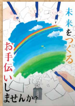
山野 愛さんの作品