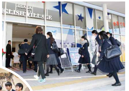
OSAKA ENGLISH VILLAGE

昨年引き続き、アメリカの文化・歴史を英語で体験できる OSAKA ENGLISH VILLAGE に行ってきました。「キャストになりきってニュース番組をつくる」「アメリカの国内旅行を体験する」など、用意されたいくつかの部屋から興味のあるものを選び、30分のレッスンを3回受けました。レッスンに合わせた部屋の装飾や、陽気なインストラクターの方々が作り出す雰囲気の中、楽しく英語でのコミュニケーションに取り組むことができました。