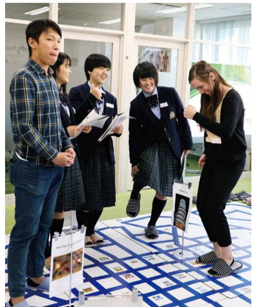
海外の人たちへ英語で道案内