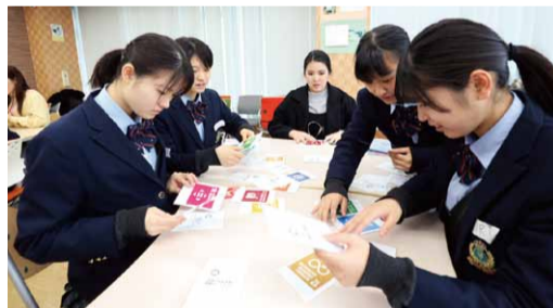
ゲームを通してSDGsの理解を深めよう

流暢に意見交換をしている生徒もいれば、単語だけでも物怖じせず自分の意見や考えを何とか伝えようとしている生徒もいました。楽しみながら積極的に参加している生徒たちの姿が印象的でした。