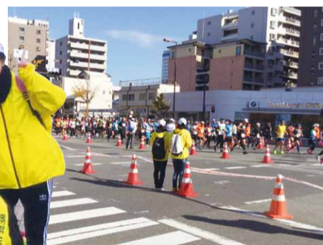
大阪マラソン応援ボランティアに参加した大阪学芸ボランティアサークルのみなさん