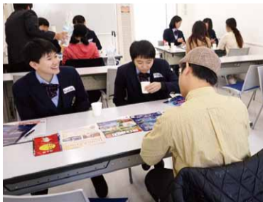
海外の方に大阪の魅力を伝えよう