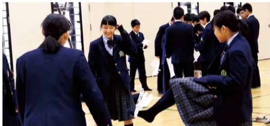
韓国出身のサポーターと