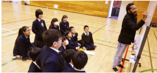
エジプト出身のサポーターと

今年度はエジプト・韓国・ネパール・ベトナム出身のサポーターの方々に来ていただきました。それぞれの出身国についての紹介を聞いたあと、体育館では各国の遊びを実際に体験しました。サポーターの方々の説明は丁寧でわかりやすく、生徒たちも楽しみながら文化を学び、交流を深めることができました。