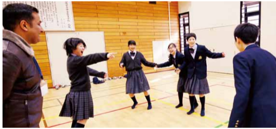
ネパール出身のサポーターと